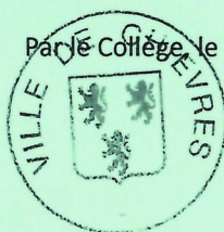
Mme M-L VANWIELENDAELE